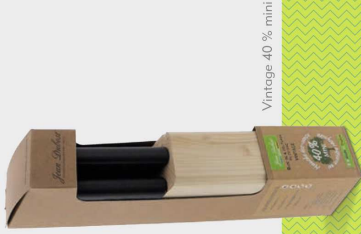
Vintage 40 % mini

Chez Jean Dubost cela fait bien longtemps qu'on a compris que les déchets pouvaient et devaient être revalorisés.