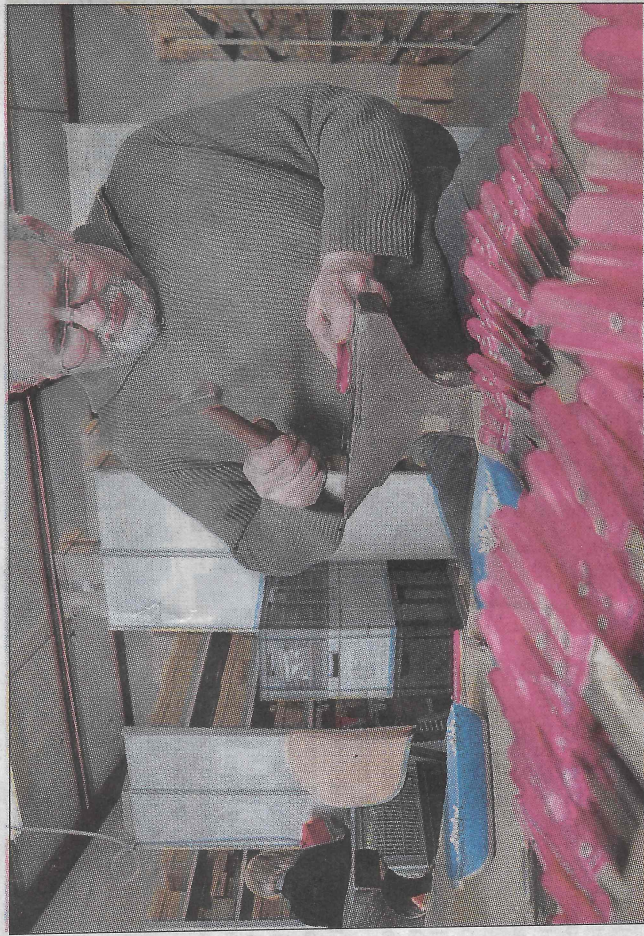
Une visite de l'entreprise Jean Dubost, à Viscomtat, est organisée jeudi 21 mars, pour les demandeurs d'emploi.

SARAH DOUVITZ sarah.douwitz@centrefrance.com