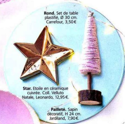
Rond. Set de table plastifié, Ø 30 cm. Carrefour, 3,50€