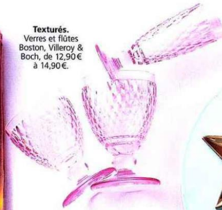
Texturés. Verres et flûtes Boston, Villeroy & Boch, de 12,90€ à 14,90€.