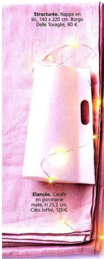
Structurée. Nappe en lin, 140 x 220 cm. Borgo Delle Tovaglie, 80 €.