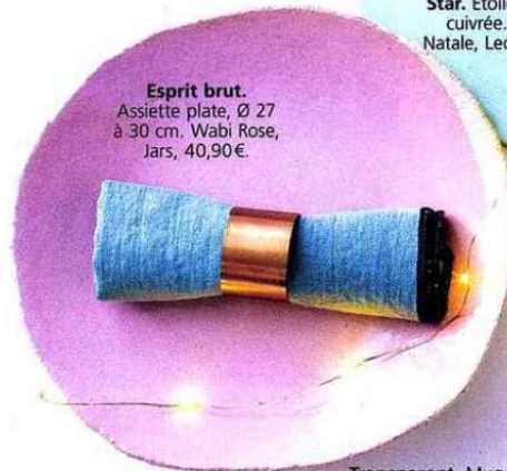
Esprit brut. Assiette plate, Ø 27 à 30 cm. Wabi Rose, Jars, 40,90€.