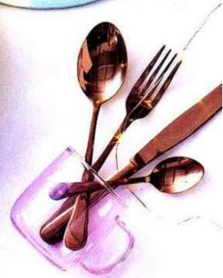
Transparent. Mug en verre rose. Fleux, 19€. Galbés. Couverts en Inox finition cuivre. Aéro Copper, Jean Dubost, de 3,40 € à 4 € pièce.