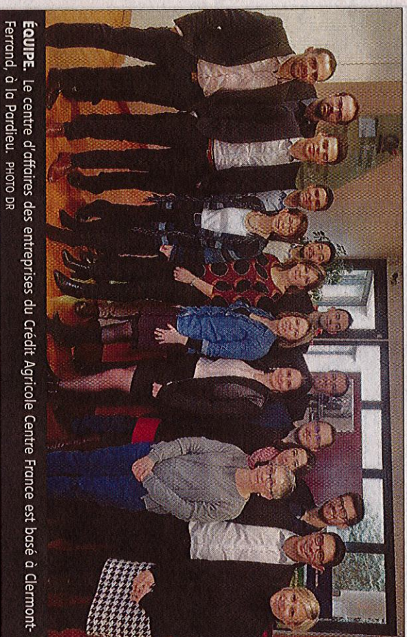
ÉQUIPE. Le centre d'affaires des entreprises du Crédit Agricole Centre France est basé à Clermont-Ferrand, à la Pardieu.

Au travers de « son engagement, de sa connais-