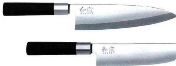
Couteaux Deba (hachoir) et Nakiri (couteau à légumes) de la collection Wasabi Black. Lame polie en acier inoxydable et manche en poudre de bambou moulé à chaud sur la soie - Kai