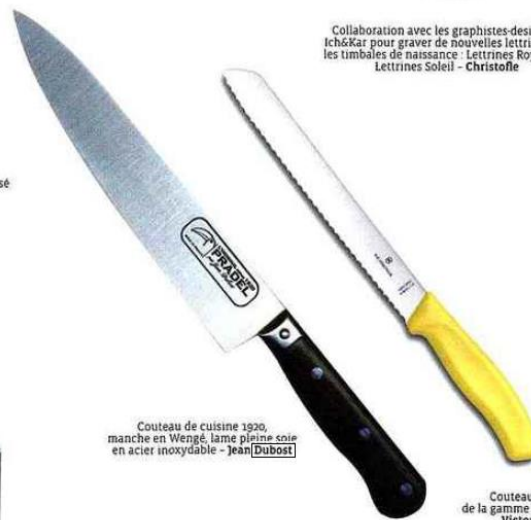
Couteau de cuisine 1920, manche en Wengé, lame pleine coïté en acier inoxydable - Jean Dubost