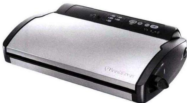
Un appareil astucieux pour mettre sous vide et conserver les aliments : il aspire et retire l'air des sacs pour les rendre parfaitement hermétiques - FoodSaver