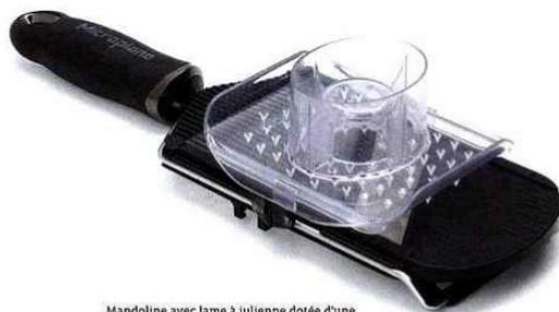
Mandoline avec lame à julienne dotée d'une lame spécifique pour julienne, d'un levier réglable sur 3 positions et d'un poussoir de protection - Microplane