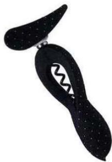
Chic Lady Dots extrait en beauté et en douceur les bouchons des bouteilles. Sa poignée Swing System (système breveté) s'adapte au mouvement de la main. Prise sans effort - L'Atelier du Vin