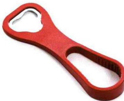
Ouvre-bouteille à double fonction qui ouvre les capsules des bouteilles de bière et dévisse les capuchons sur tous types de bouteilles en plastique. Simple et rapide - Royal VKB