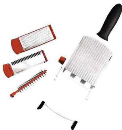
Mandoline multifonctions et ses accessoires. Poignée et rebords anti-dérapants pour éviter qu'elle ne bouge pendant l'utilisation - Cuisipro