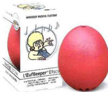
Nouveaux coloris et répertoires pour l'œuf Beeper dédié à la cuisson des œufs : Rock, Classique ou le rose Disco - Brainstream