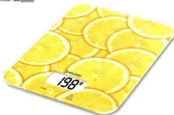
Balance culinaire Berry, Fresh ou Lemon Beurer