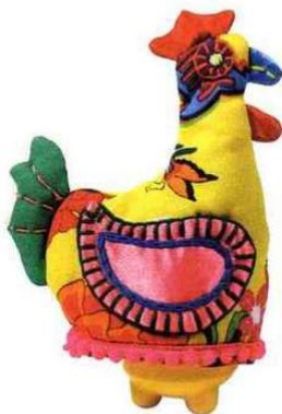
Coquetier Cache-Poule en mélamine et en tissu Fragonard