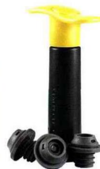
Rafraichisseur et pompe à vin de la gamme Colors - Screwpull