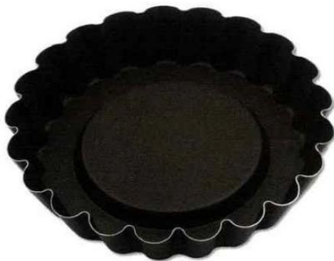
Moule à tartelette fruits frais, fond renvoyé fixe, bords cannelés, qui passe au four (température Maximum 250 °C) - Gobel