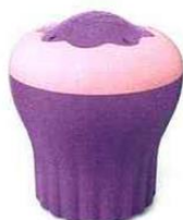
Microcake, moule pour cuire les gâteaux au micro-ondes en deux minutes chrono - Jean Dubost