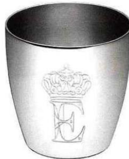
Collaboration avec les graphistes-designers Ichô&Kar pour graver de nouvelles lettres sur les timbres de naissance: Lettrines Royales et Lettrines Soleil - Christofle