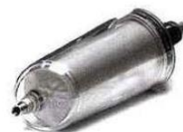
Refroidisseur instantané pour consommer le vin blanc ou le vin rouge à la température adéquate. Invention québécoise brevetée distribuée en France par Microplane - Ravi