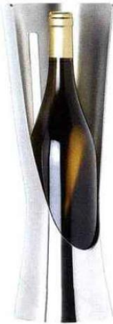
Rafrichissoir D-Vin Robe en étain massif brossé et poli fait main - OA 1710