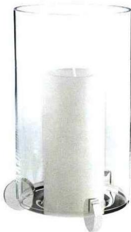
Photophore en métal argenté et verre transparent, collection Galet - Ercois