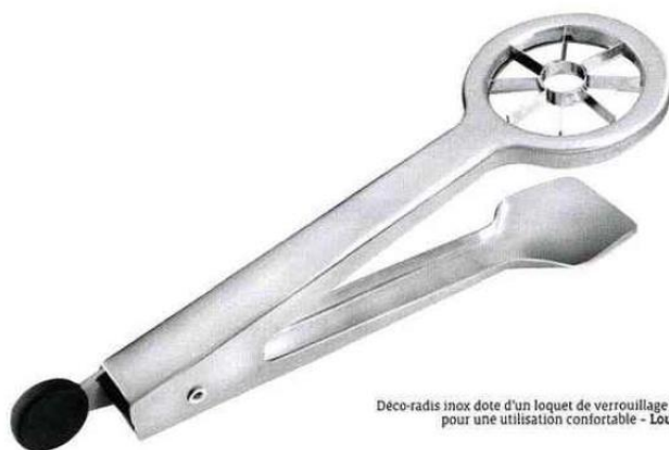
Déco-radis inox dote d'un loquet de verrouillage au bout du manche pour une utilisation confortable - Louis Tellier