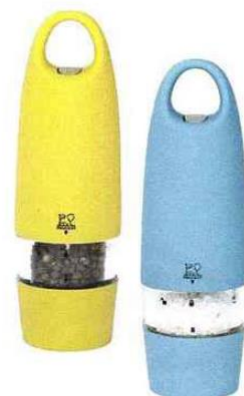
Moulins électriques à poivre et à sel Tilleul et Lagon Peugeot