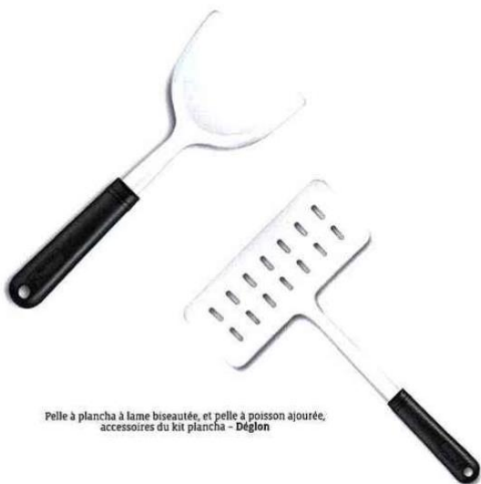
Pelle à plancha à lame biseautée, et pelle à poisson ajourée, accessoires du kit plancha - Déglon