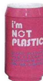
Canette isotherme et lunch box design écologiques car biodégradables Sefama