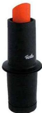
Presse-ail Q! dont la partie supérieure en silicone facilite la prise en main. En appuyant plus ou moins fort, on peut déterminer la longueur des morceaux d'ail coupés - Fissler