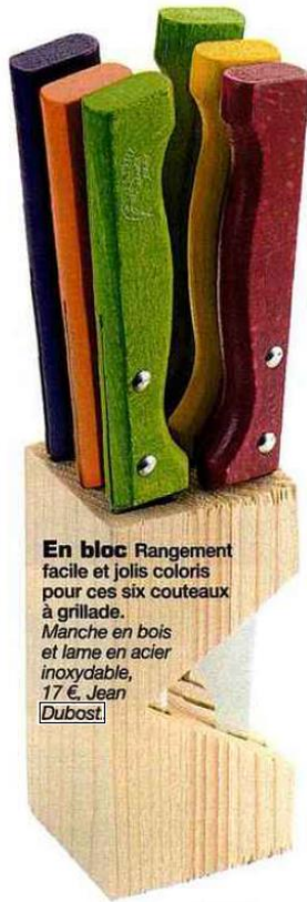
En bloc Rangement facile et jolis coloris pour ces six couteaux à grillade. Manche en bois et lame en acier inoxydable, 17 €, Jean Dubost.