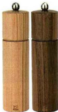
Au naturel En cuisine ou sur la table, la nature met son grain de sel avec ces moulins en noyer et en merisier. Moulin Châtel, H 21 cm, 49 €, Peugeot.