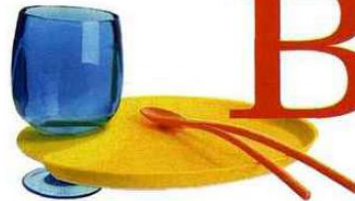
Nomade On glisse le pied de son verre dans l'encoche de cette assiette pour tenir le tout d'une seule main ! Assiette et cuillère-pince en polypropylène, 5,75 € pièce, Kozioł. Verre à pied Stacky, 5 €, chez Zak ! Designs.

Avec ces ustensiles flashy, vos déjeuners au jardin et vos soirées barbecue en voient de toutes les couleurs.