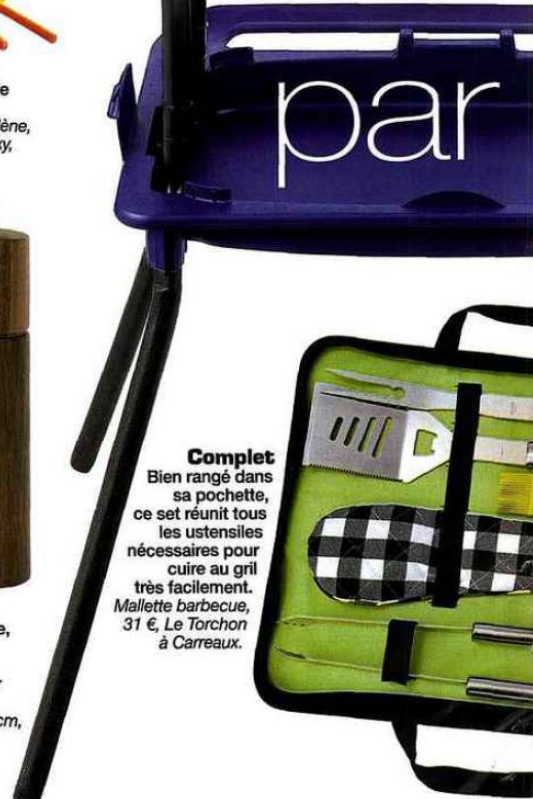
Complet Bien rangé dans sa pochette, ce set réunit tous les ustensiles nécessaires pour cuire au grill très facilement. Mallette barbecue, 31 €, Le Torchon à Carreaux.