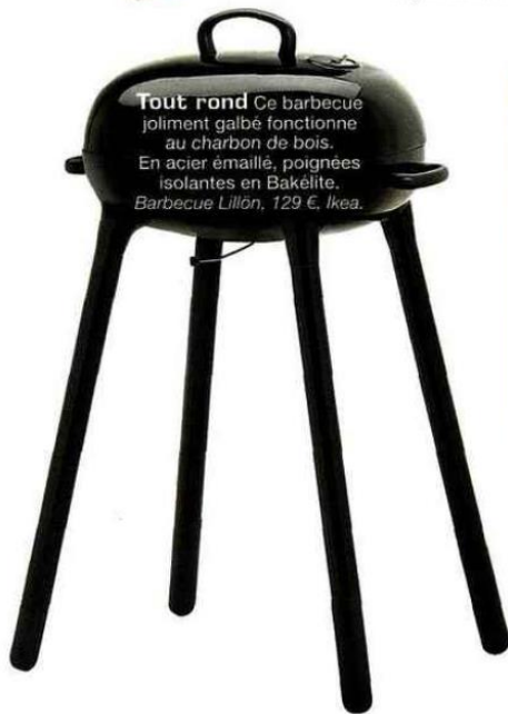
Tout rond Ce barbecue joliment galbé fonctionne au charbon de bois. En acier émaillé, poignées isolantes en Bakélite. Barbecue Lillón, 129 €, Ikea.